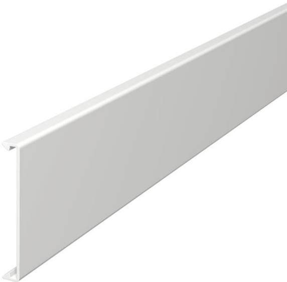
Couvercle pour l'obturation des goulottes.