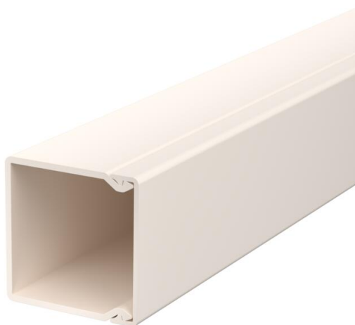
Parties supérieure et inférieure de goulotte avec fond perforé